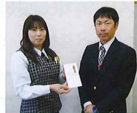
会津ヤクルト販売(株) 様