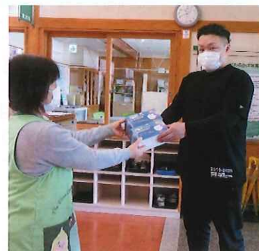
● リアン様より、不織布マスク100枚を寄附していただきました。