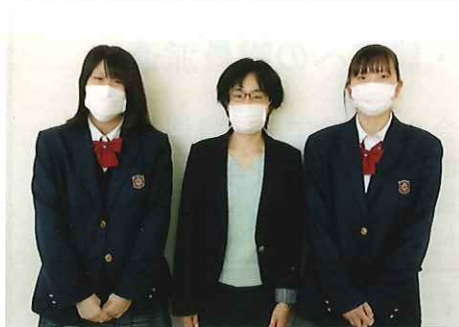
● 田島高等学校茶道部様より、12,155円を寄附していただきました。