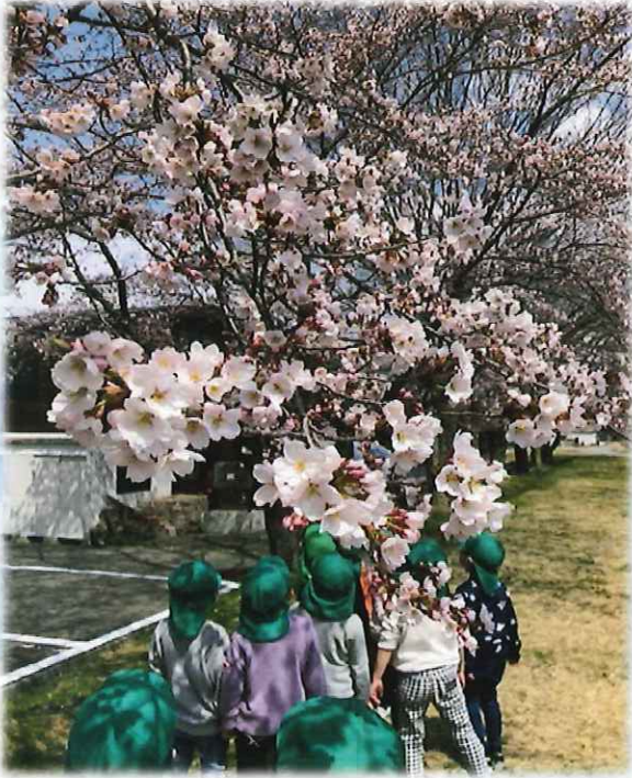
びわのかげ保育所 にじ組 桜の木の下で