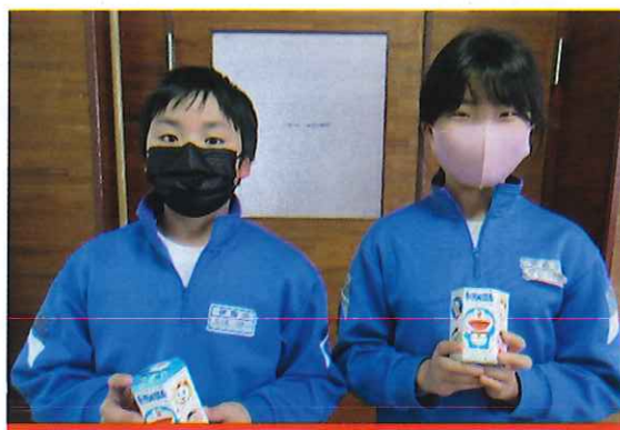
伊 南 小 学 校

▼令和4年1月18日（火）に伊南小学校様より、学校募金として9,436円をお寄せいただきました。あたたかいご協力、ありがとうございました。