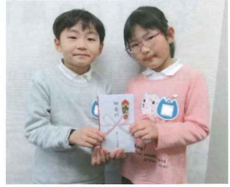
▲田島カトリック暁の星幼稚園代表園児のお二人が来所されました。 【令和5年3月13日(月)】