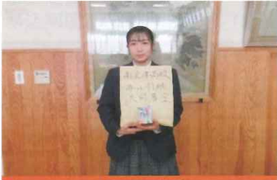
南会津高等学校（本校舎）